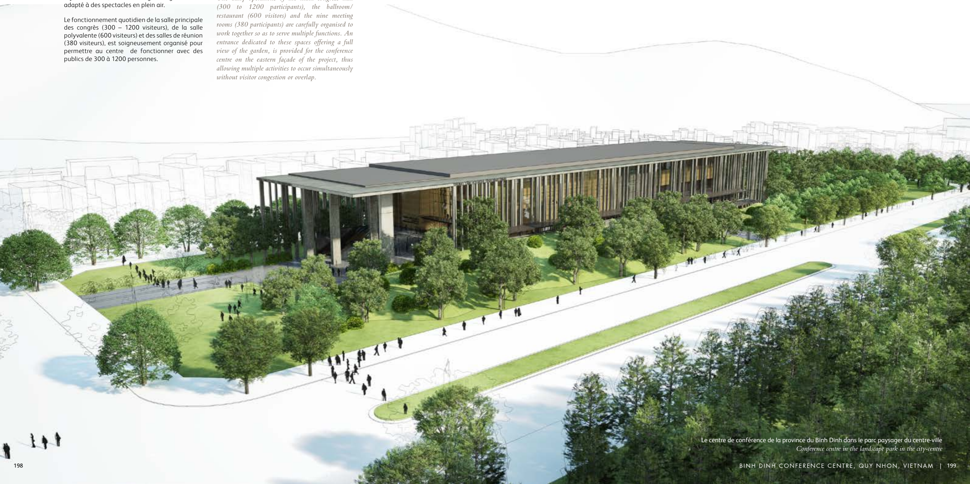
Le centre de conférence de la province du Binh Dinh dans le parc paysager du centre-ville Conference centre in the landscape park in the city-centre

The daily operations of the main congress hall (300 to 1200 participants), the ballroom/restaurant (600 visitors) and the nine meeting rooms (380 participants) are carefully organised to work together so as to serve multiple functions. An entrance dedicated to these spaces offering a full view of the garden, is provided for the conference centre on the eastern façade of the project, thus allowing multiple activities to occur simultaneously without visitor congestion or overlap.