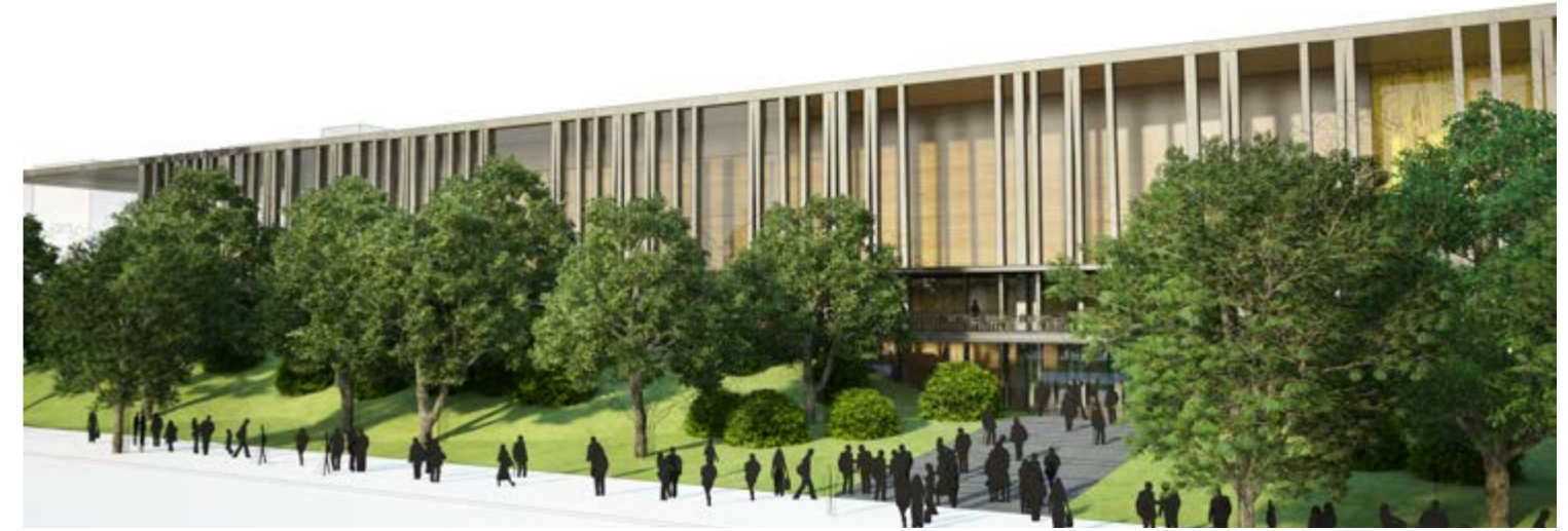
Entrée latérale du centre de conférence / Lateral entrance of the conference centre

Additionally, the centre is able to host smaller conferences for between 300 to 600 participants. These can be held in the large congress hall with an optimal seating configuration for meetings on a more intimate scale. Access to and operation of these rooms are the same as those for larger conferences. For certain special events, the congress-hall space may be linked with the ballroom to allow performances, presentations and guests freer movement from one to the other, and vice versa. At the same time, these spaces have been designed to allow the general public in the congress hall access to the ballroom through the back stage, for special events and select exhibitions.