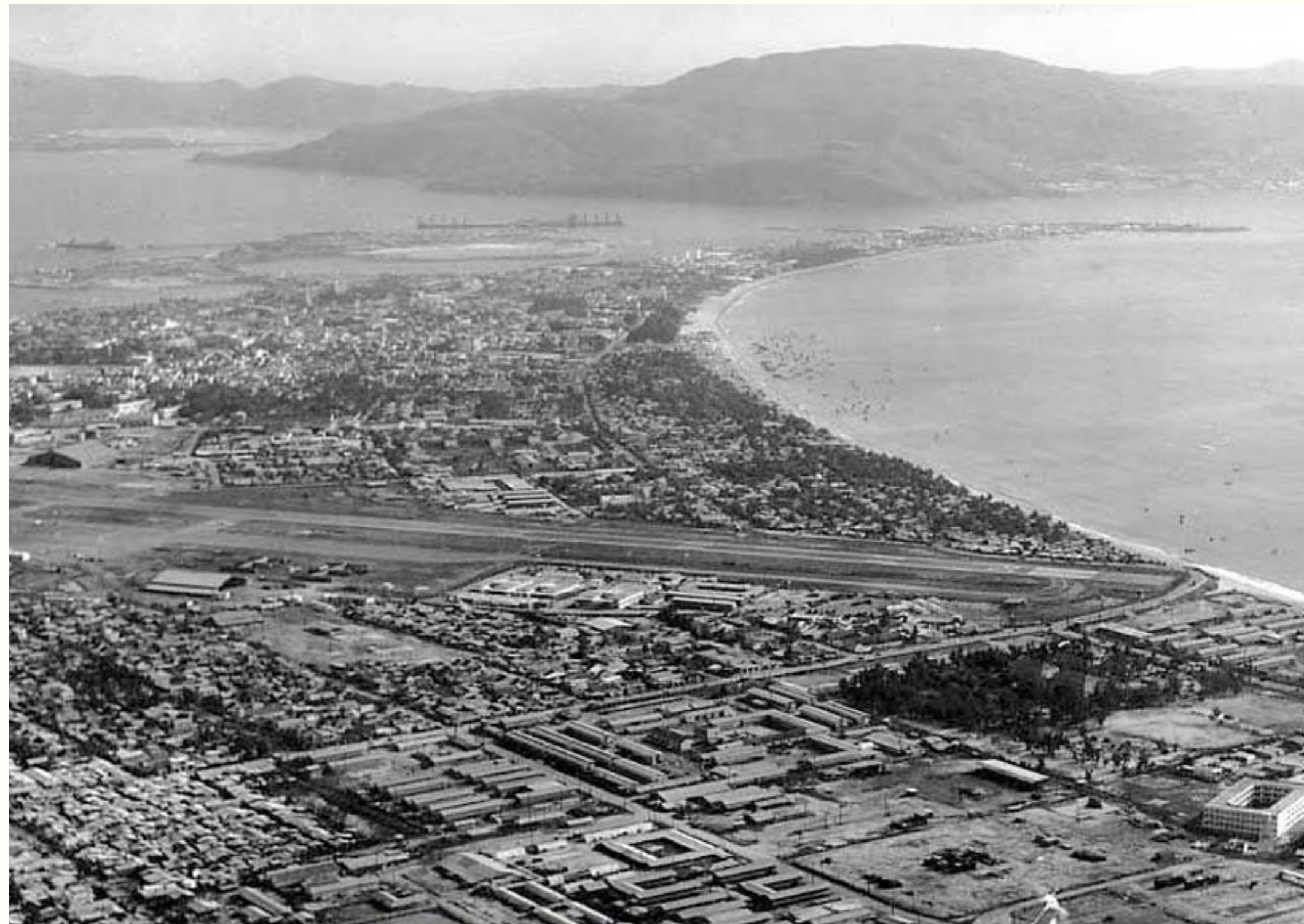
Le centre de conférence est construit sur l'ancienne piste de l'aéroport militaire de Quy Nhon dans les années 60 The conference centre is built on the footprint of the military airport in the 60s