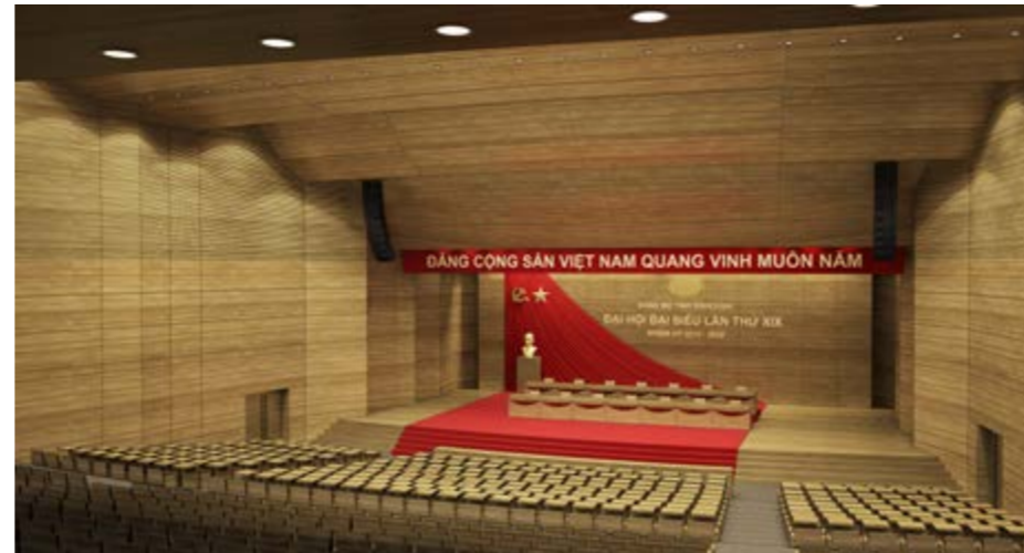
La grande salle en configuration de congrès / The main hall in the congress configuration