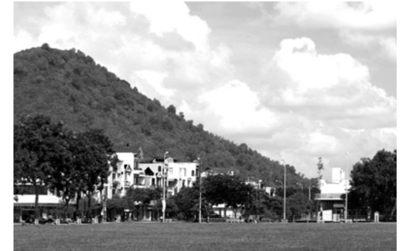
Le site du projet avant travaux, au pied de la colline / Project site at the foot of the hill, before construction