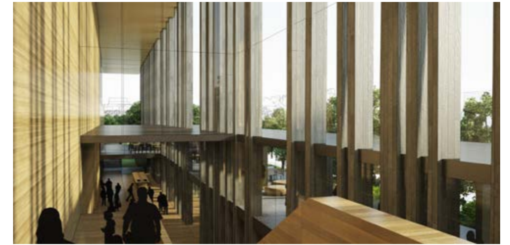
L'accès à la grande salle / Access towards the grand hall