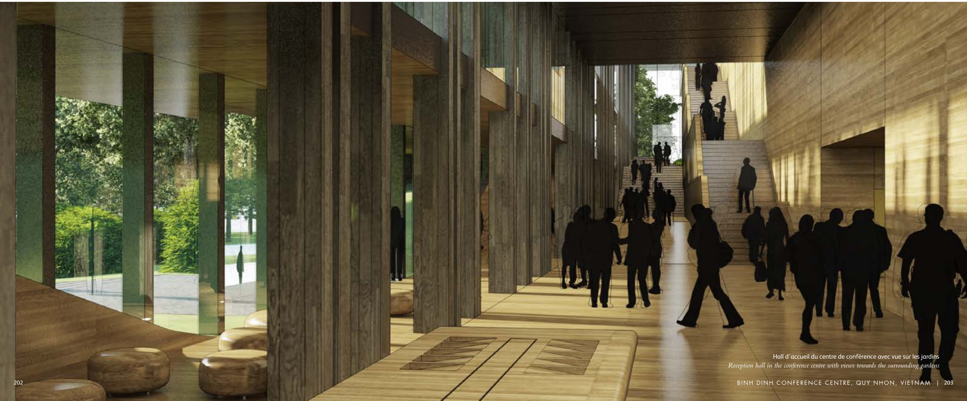
Hall d'accueil du centre de conférence avec vue sur les jardins Reception hall in the conference centre with views towards the surrounding gardens