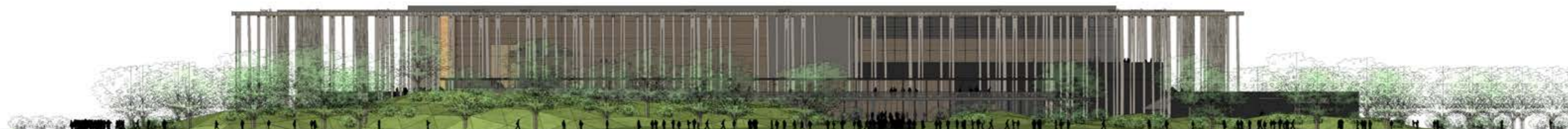
La façade longitudinale Est du projet, côté entrée de la salle conférence / East facade of the project, entrance to conference rooms