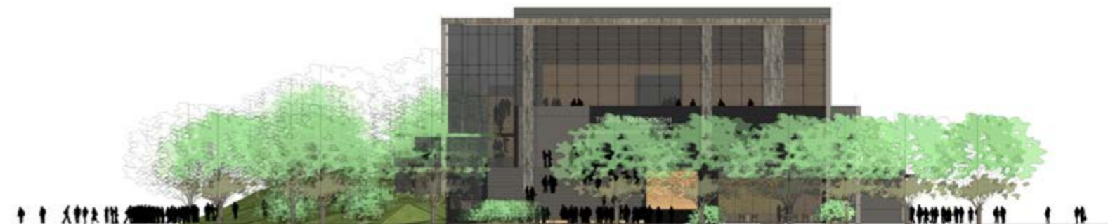
La façade Nord du projet, côté salle de réunion / North facade of the project, entrance to the meeting rooms