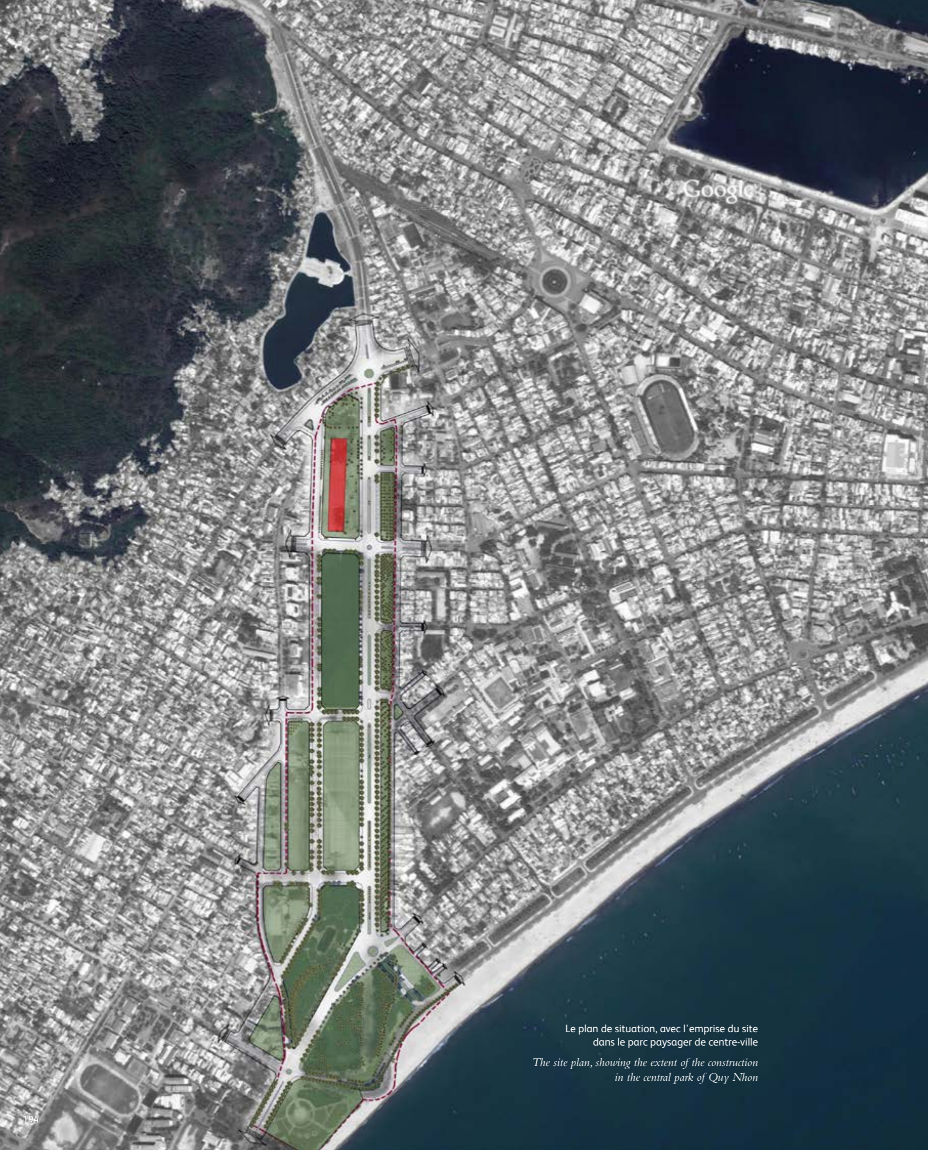
Le plan de situation, avec l'emprise du site dans le parc paysager de centre-ville The site plan, showing the extent of the construction in the central park of Quy Nhon