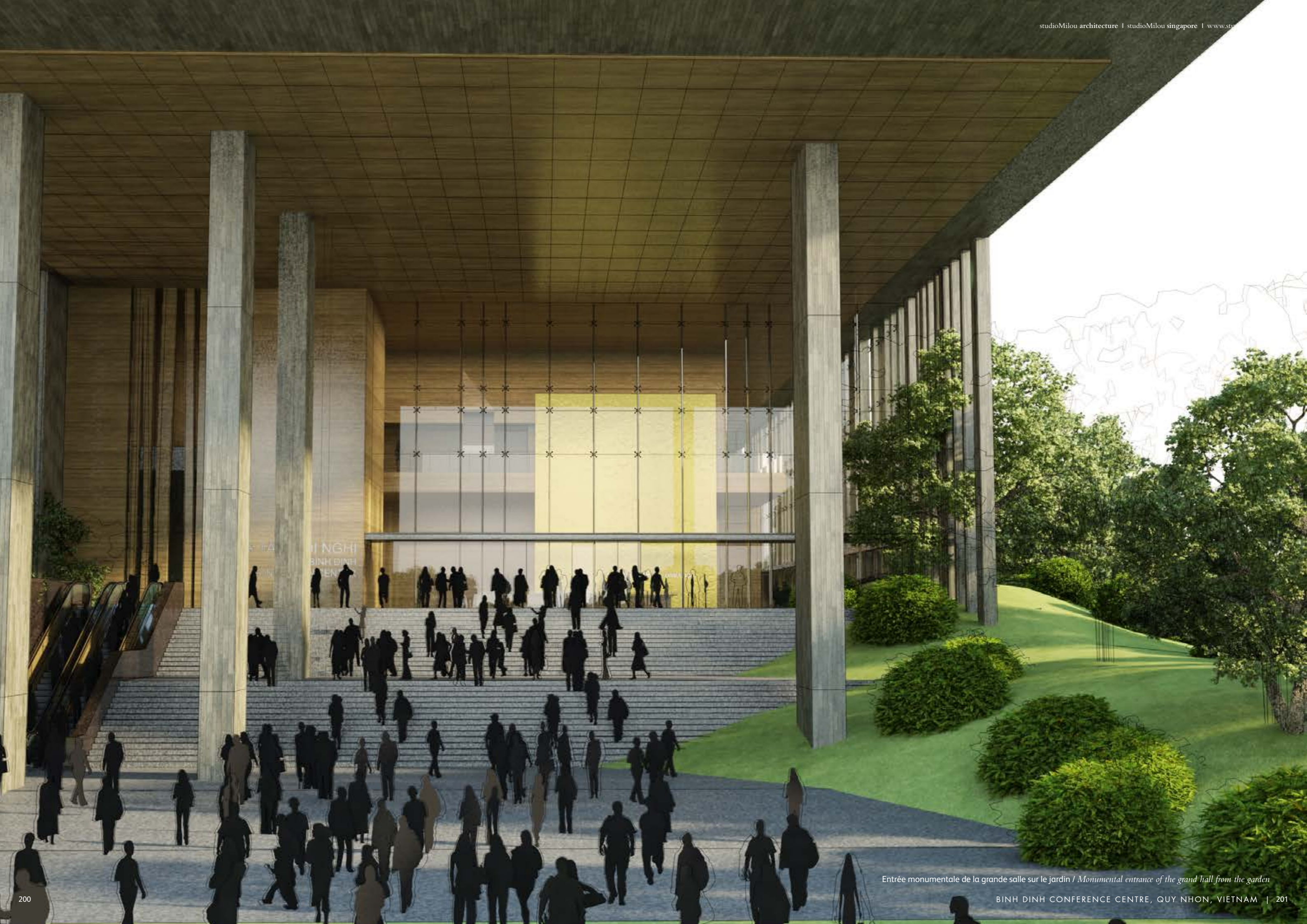
Entrée monumentale de la grande salle sur le jardin / Monumental entrance of the grand hall from the garden